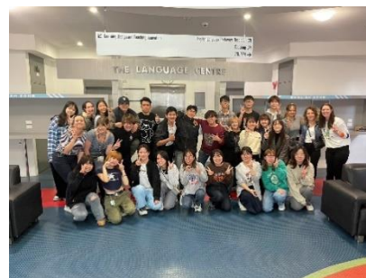
学校の友人たちと