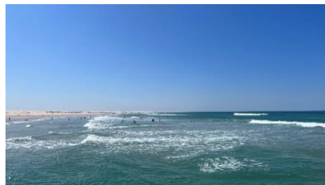
アルビノのカンガルー