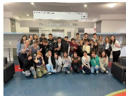
学校の友人たちと