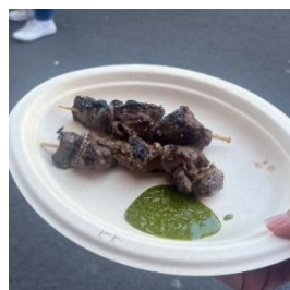
ロックスマーケットのカンガルー肉