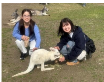
アルビノのカンガルー