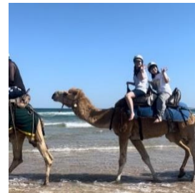
Anna Bay で